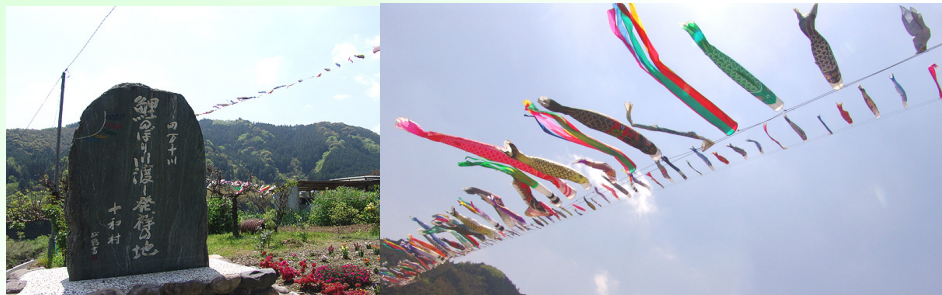
↑ 一昨年建てられた記念碑と、こいのぼり公園から見上げた時の鯉のぼりの様子↑