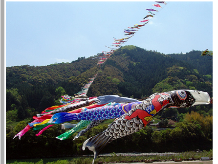
↑ 国道側から見た鯉のぼり