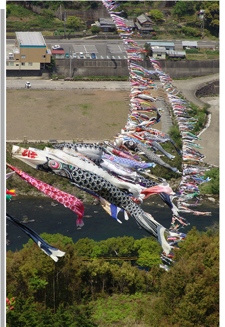
↑ 展望台から見下ろした様子

まだこの鯉のぼりをご覧になっていない方はぜひ一度当地にお越し下さい。すぐ近くには昨年オープンしたばかりの「道の駅とおわ」もありますから、きっと楽しいドライブになると思いますよ！！