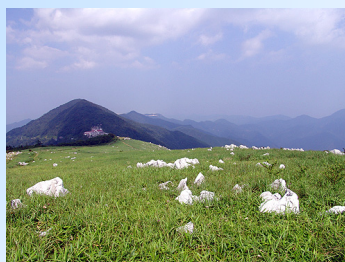
↑ 四国カルスト・天狗高原 （平均標高約1400m）

1ヶ月前なのにすでに予約が7名も入っているとので、天空の爽回廊 そうかいろう で癒されたいという方はお急ぎ下さい！！