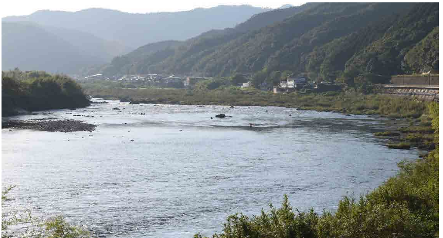
四万十川中流四万十町小野の瀬 鮎漁禁漁2日前の風景 (2020.10.13)