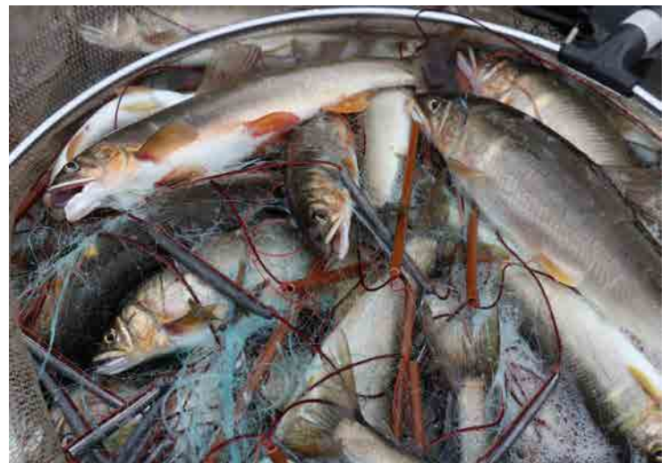
四万十川本流家地川堰堤上 投網一投げで大量の鮎 (2020.10.16)