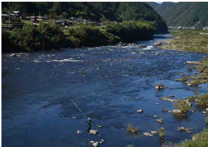
四万十川中流四万十町小野の瀬 友釣りの風景 (2020.10.06)

毎年、謎を残して去っていく鮎。今、産卵期を迎えている。仔魚流下調査も好調のようだ。今年はたくさん楽しませてくれてありがとう。また、来年たくさん戻ってきますように。