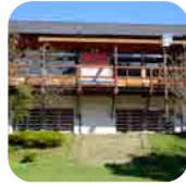
シャワー・トイレ棟