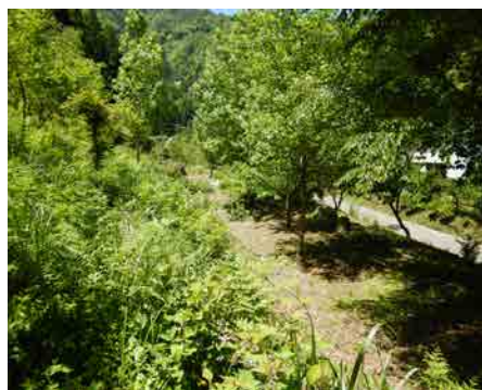
↑ 向かいの山にはさまざまな山菜があります。