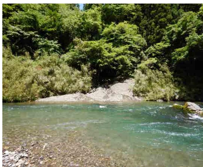
↑温泉のすぐ下を流れる北川川